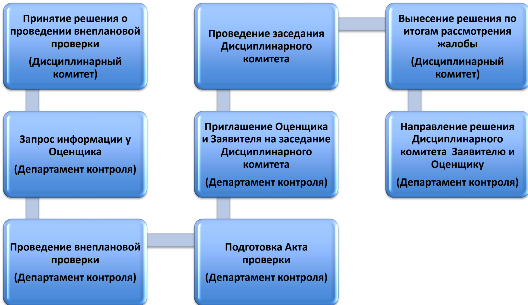
Схема рассмотрения жалоб