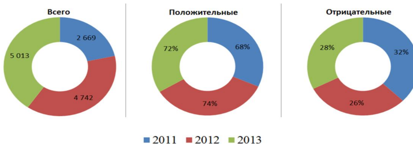
Соотношение положительных и отрицательных экспертиз в пяти СРОО в 2011-2013 гг.