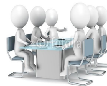
Круглые столы в регионах РФ