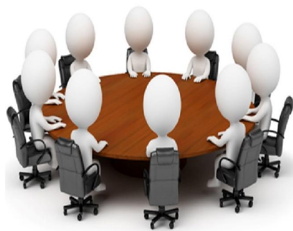
Круглый стол в ГД РФ 29 октября 2015 г.