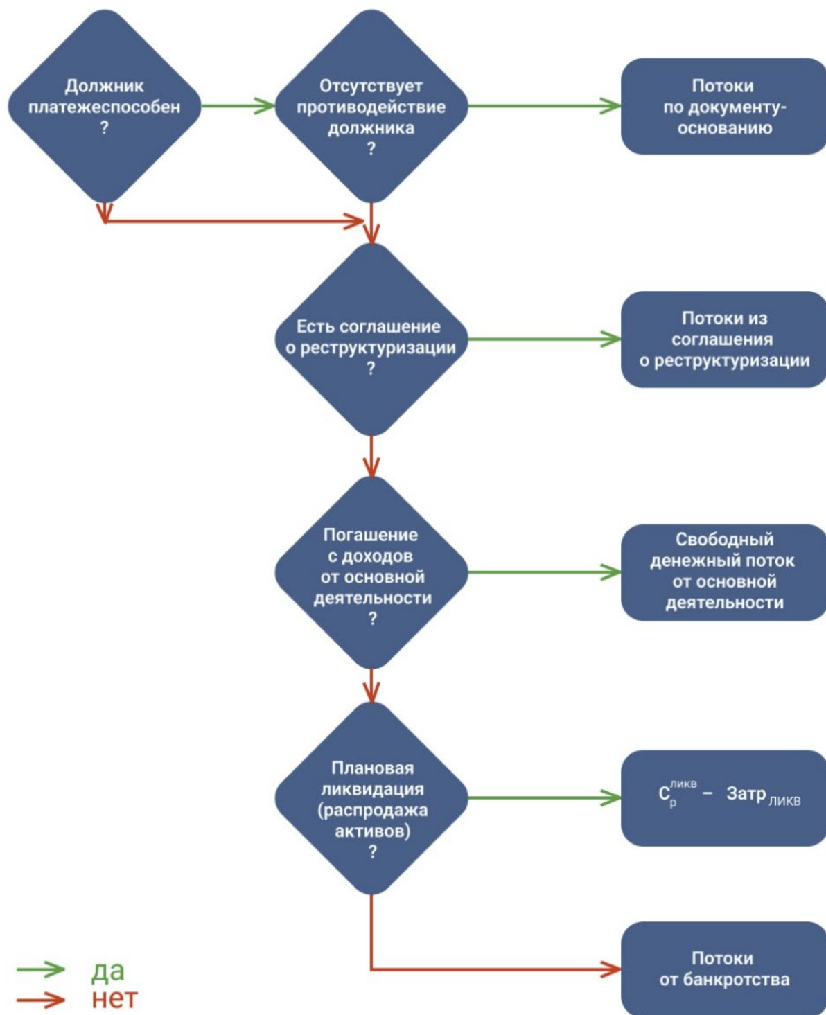
Рис. 1. Алгоритм определения источников погашения Задолженности (сценариев погашения)